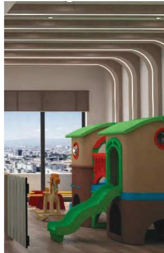
منطقة ألعاب للأطفال Kids' Play Area