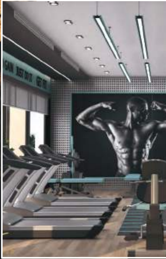
صالة رياضية Gym

Sufana Residential Tower promises you an entertainment zone to create lifetime memories with your families. You can sustain your fitness in the gym, breath in the magnificence of the views from the terrace, enjoy your privacy in your private pool, or have fun with your children in the kids' play area.