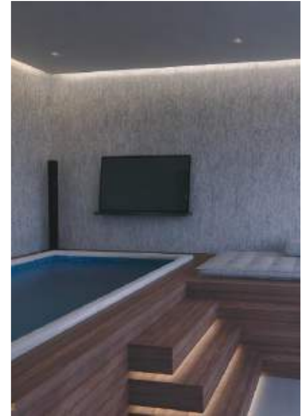
مسبح خاص بكل شقة Private Pool