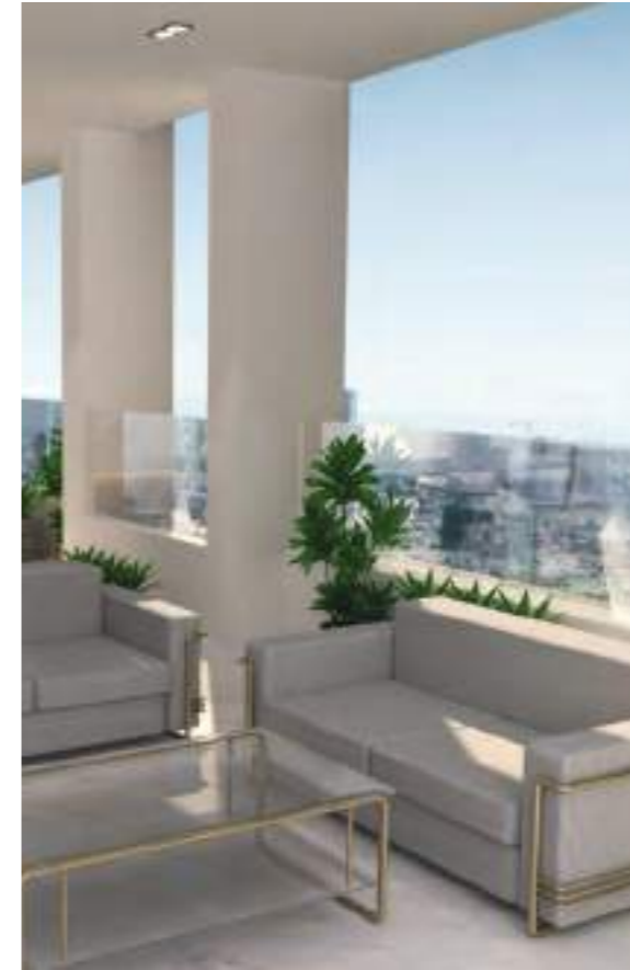
تراس Open Terrace